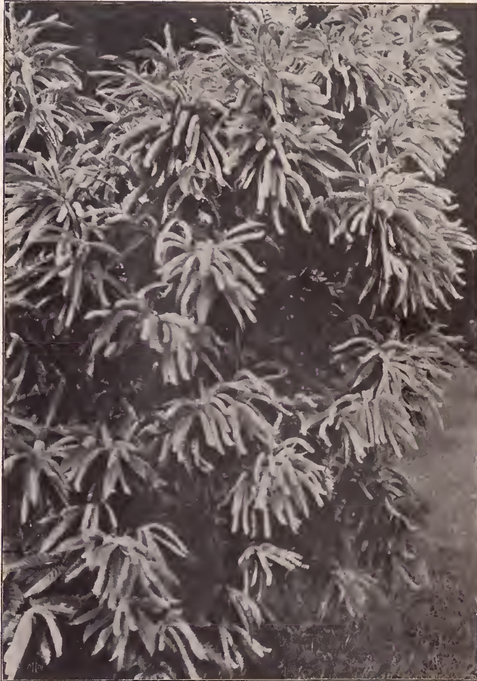
Blütenrispen der Edelkastanie in Mon Repos